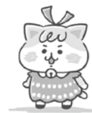
にゃんちゃん CV: 花江夏樹

んかむちゅ〜」キャラクターを使用したい、イベント会場で動画を放映したい場合は、学会事務局までご相談願います。