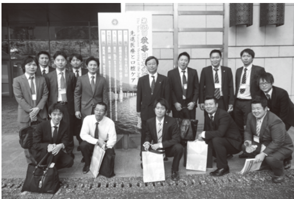
写真1 2013年秋季大会、PDIメンバーと

常に冷静で誠実、臨床と学問の両立を重んじる荒木先生のお姿は、これまで指導していただいた多くの後